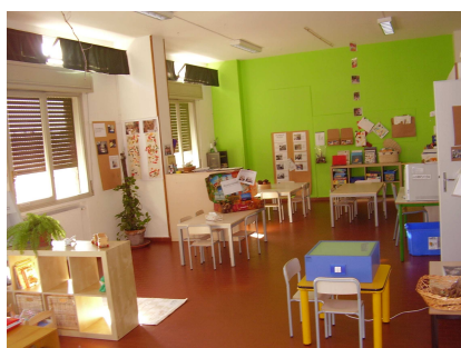
Sezione quattro anni