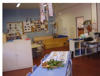
Sezione cinque anni