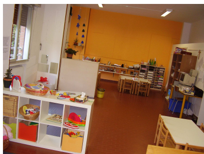
Sezione tre anni