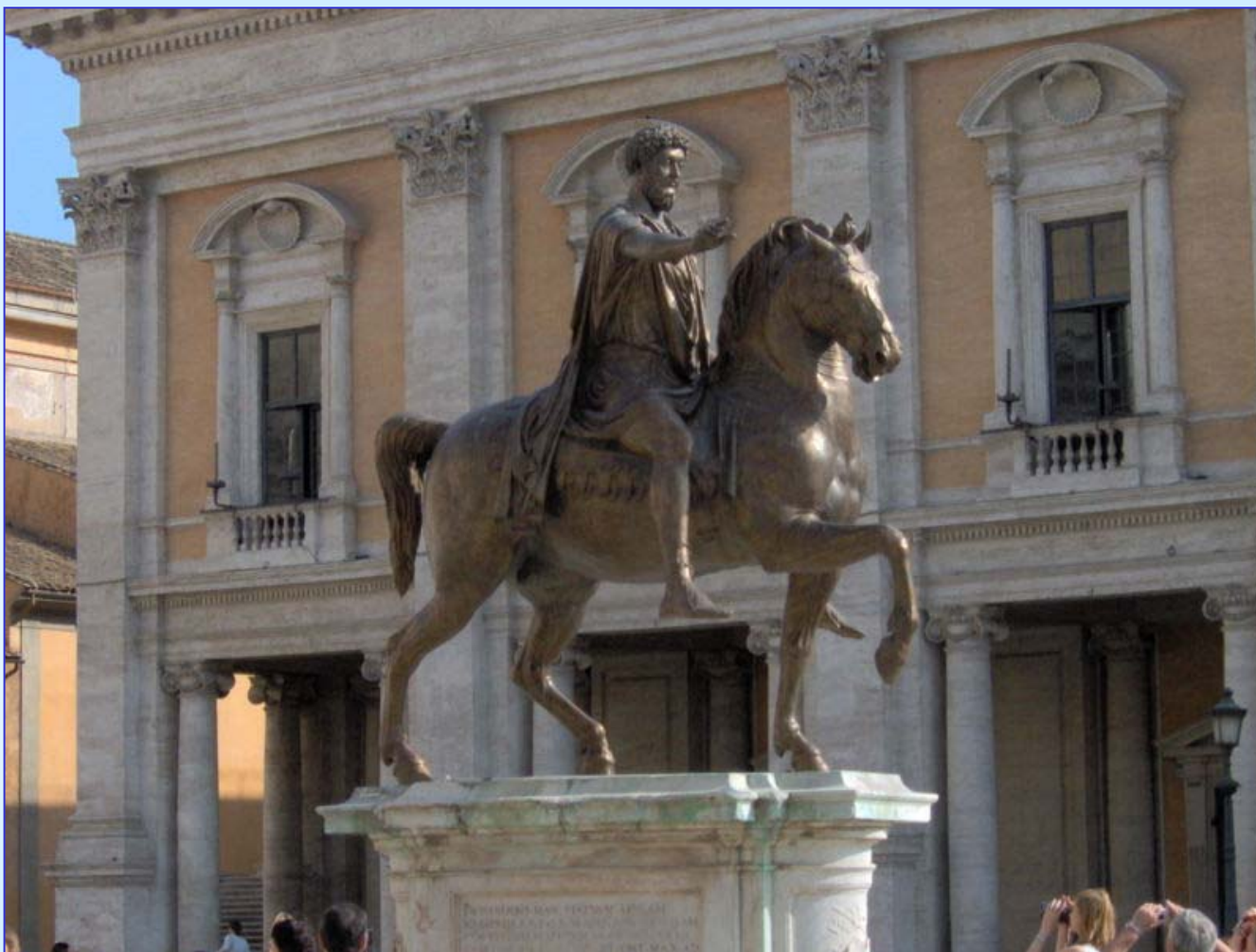
Statua equestre di Marco Aurelio